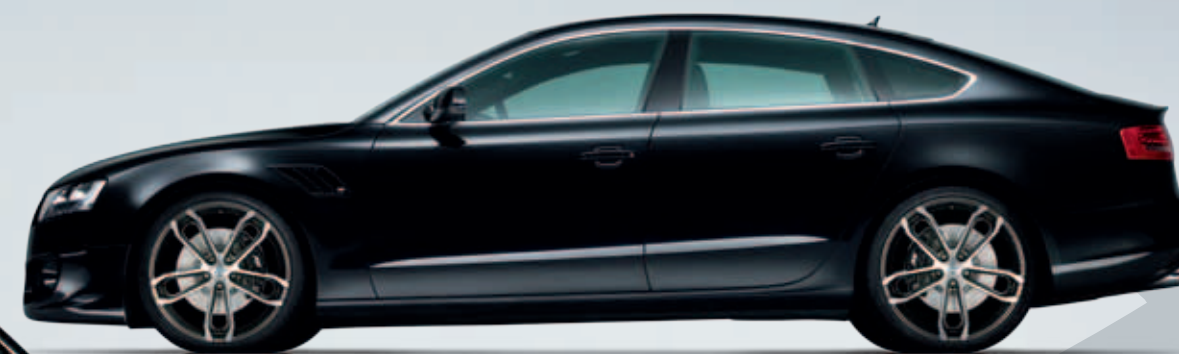
ABT CR Sportfelge. Leicht, souverän, formvollendet und unendlich kraftvoll.