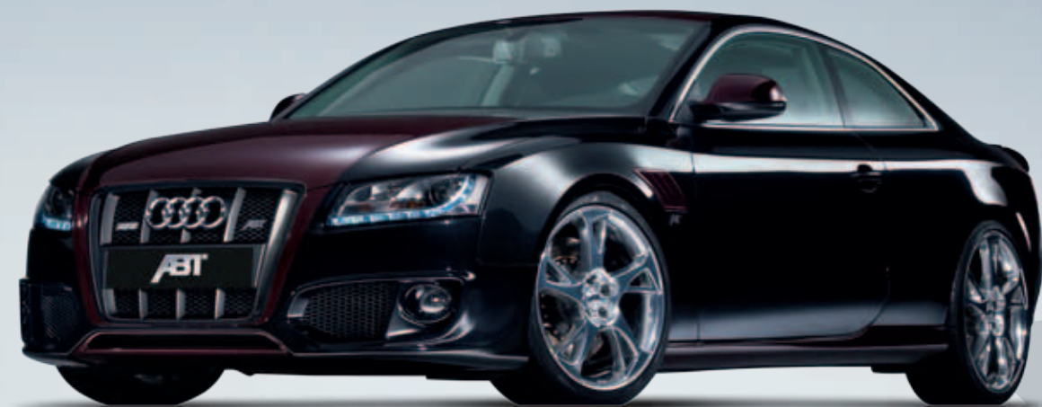
ABT BR Sportfelge. Diamantbedreht, tiefschwarz mattiert oder hochglanzpoliert, optional mit versteckten Ventilen, gewichtsoptimiert und perfekt im Handling.