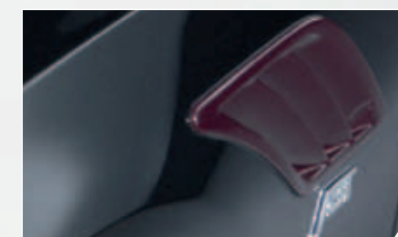
ABT Kotflügel-einsätze. Kraftvolle Optik bis ins Detail.