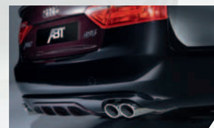
ABT Heckschürzenset. Inklusiv ABT 4-Rohr-Endschalldämpfer.

Kraft, einzigartige Eleganz und eine Linienführung, die ihres gleichen sucht. Diese Attribute sind bereits ab Werk untrennbar mit dem Namen Audi A5 verbunden. Das war beim Coupé so und das setzt sich mit den Varianten A5 Cabriolet und Sportback nur konsequent fort. Umso beeindruckender ist die Leistung der Ingenieure und Designer von ABT: Sie haben es tatsächlich geschafft, die Ingoldstädter Edelkarossen noch feiner zu machen. In Sachen Dynamik ebenso wie bei der Optik – mit einem spektakulären Body-Kit, verbessertem Motormanagement, Turbolader, ABT Gewindefahrtfahrwerk, ABT Bremsanlage und Sportfelgen von 18 bis 20 Zoll zur perfekten Abrundung.