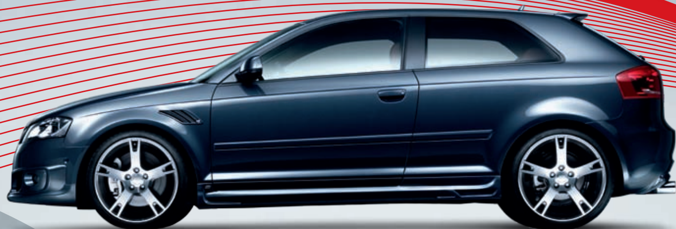
ABT AR Sportfelge. Diamantbedreht mit exklusivem Finish. Gewichtsoptimiert und mattschwarz lackiert. Eine Klasse für sich.