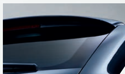
ABT Heckflügel. Dynamisch-dezente Eleganz.