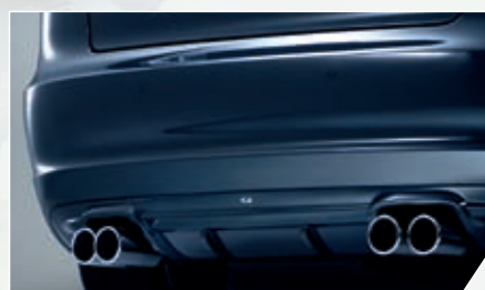
ABT Heckschürzenset. Inklusive ABT 4-Rohr-Endschalldämpfer.

Er ist kompakt. Er ist perfekt proportioniert. Und er bringt genau das auf die Straße, was von ihm verlangt wird: Kraft und Fahrspaß. Ohne Ende. Ohne Kompromisse. Ungeschlagen in seiner Klasse. Der AS3 mit dem Besten, was ABT zu bieten hat - hochwertigen Anbauteilen und natürlich jeder Menge ABT Power.