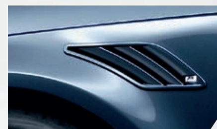
ABT Kotflügel einsätze. Kraftvolle Optik bis ins Detail.