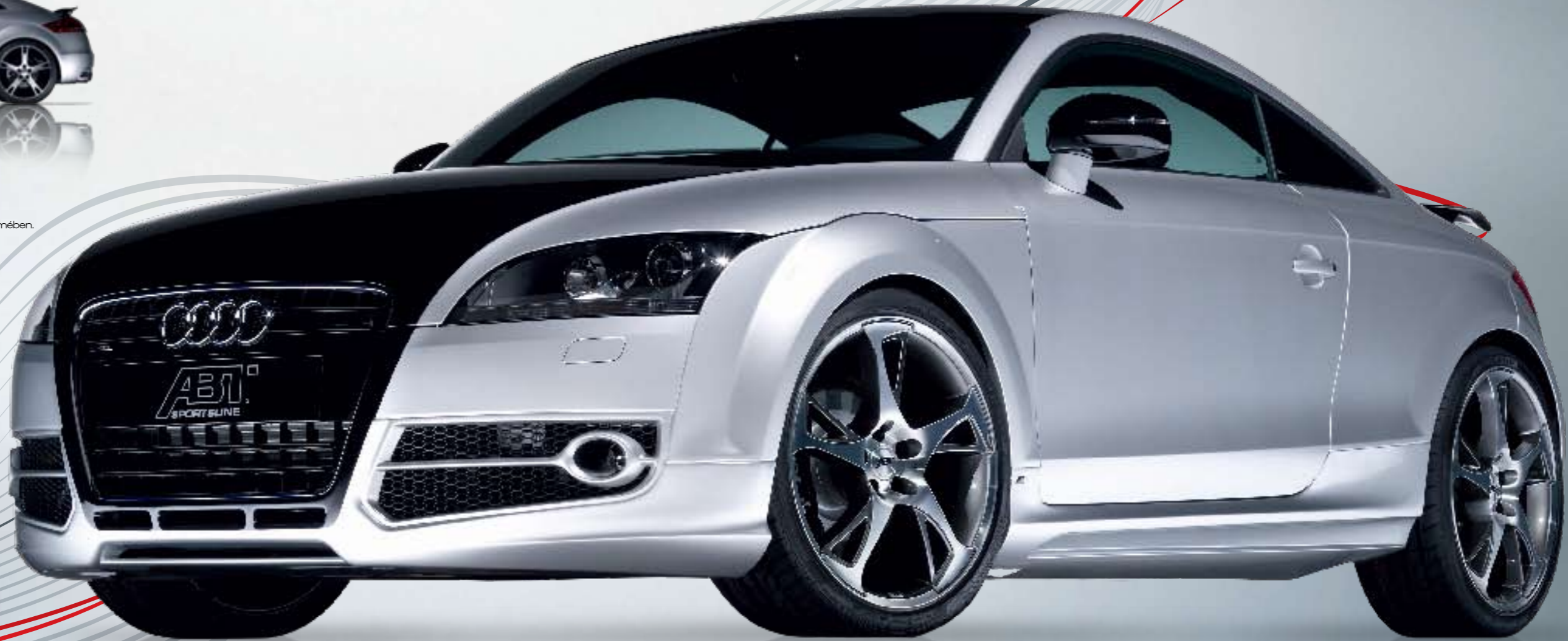
ABT BR könnyűfém keréktárcsa. Gyémánttal megmunkált vagy magasfényű polírozással, választható rejtett szeleppel, súlycsökkentett és tökéletes kezelhetőség.