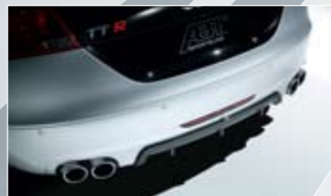
ABT hátsó kötéylemez. 4 csöves ABT kipufogó kivezetéssel.

Mi lenne izgalmasabb egy tuningosnak, mint egy majdnem tökéletes autó? Az ABT szívesen vállalta a kihívást és az Audi Roadster ékköből egy tökéletes drágakövet csiszolt. Erős motor, kiemelkedő technika és sportosan elegáns külső teszi az ABT TT Roadstert egy igazi kincsé a nyitott tetős autók kedvelőinek.