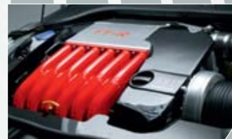
ABT Motortuning. A legisztaabb erőcsomag: ABT Power R, chiptuning és kompresszor tökéletes kombinációja.