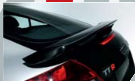
ABT hátsó szárny. Elegánsan dinamikus.