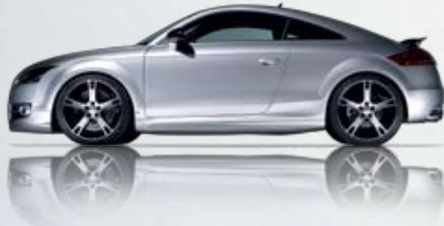
ABT AR könnyűfém keréktárcsa. Gyémánttal megmunkált tökéletes kivitel. Súlyoptimalizált antracitlakkozás. Első a maga nemében.