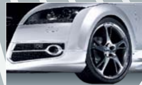
ABT BR könnyűfém keréktárcsa. Gyémánttal megmunkált vagy magasfényű polírozással, választható rejtett szeleppel, súlycsökkentett és tökéletes kezelhetőség.