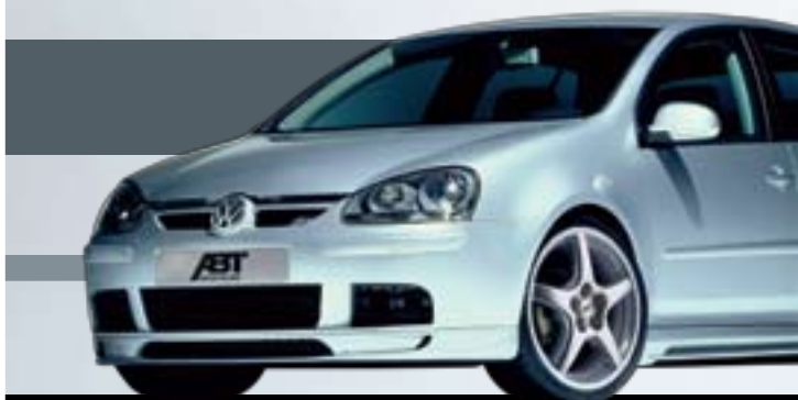
ABT Z könnyűfém keréktárcsa. Brilláns ezüst megjelenés. ABT „Z” könnyűfém keréktárcsa generáció 16, 17 és 18” méretekből.