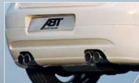
ABT kipufogó kivezetés. Nemesfémből készült, négy krómozott véggel.

A modell megnevezése magáért beszél és mára már több generáció számára is a négy keréken megfizethető erőt és agresszivitást jelent. Még ennek a már legendának számító „népsportautónak” is új arculatot tudnak kölcsönözni az ABT tuning szakeberei. 330 PS-el, tökéletesített karosszéria elemekkel, egyedi kérésre szénszálas motorburkolattal; az ABT Golf GTI minden szemlélődő, ill. utasa számára egyértelművé teszi: a legenda él. De még hogy!