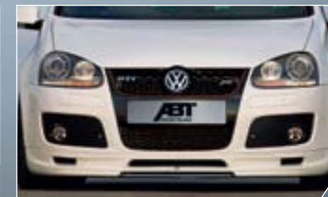
ABT Első légbemlő. Dinamikusan elegáns.