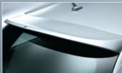
ABT hátsó spoiler Audi A6 Avant-hoz. Elegánsan dinamikus.