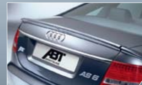
ABT hátsó szárny az Audi A6 Limuzinhoz. Elegánsan dinamikus.