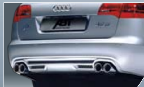
ABT hátsó kőténylemez szett. 4 csöves krómozott ABT kipufogó kivezetéssel.