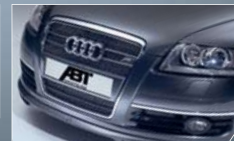
ABT első kőténylemez és hűtődszrács. Teljesen egyedi kinézetet illetve kivételes sportosságát kölcsönöz.