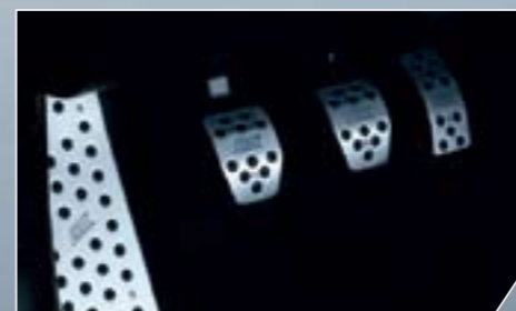
ABT alumínium pedálok. Matt eloxált, gravírozott logóval.